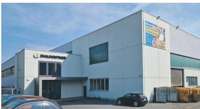
Die DIALOGISTIKER bieten Dialog, Druck und Logistik aus einer Hand.

Mit einer Schnittlänge von 560 mm, einer Schnitthöhe von 80 mm, einem Restschnitt von kleiner 15 mm sowie einer Einlegetiefe von 560 mm lassen sich die grundsätzlichen Spezifikationen dieses kompakten, programmierbaren Stapelschneiders kurz und knapp auf den Punkt bringen. THE 56 verfügt über eine beachtliche Ausstattung und setzt in dieser Produktklasse mit einem besonders attraktiven Preis-Leistungs-Verhältnis starke Maßstäbe.